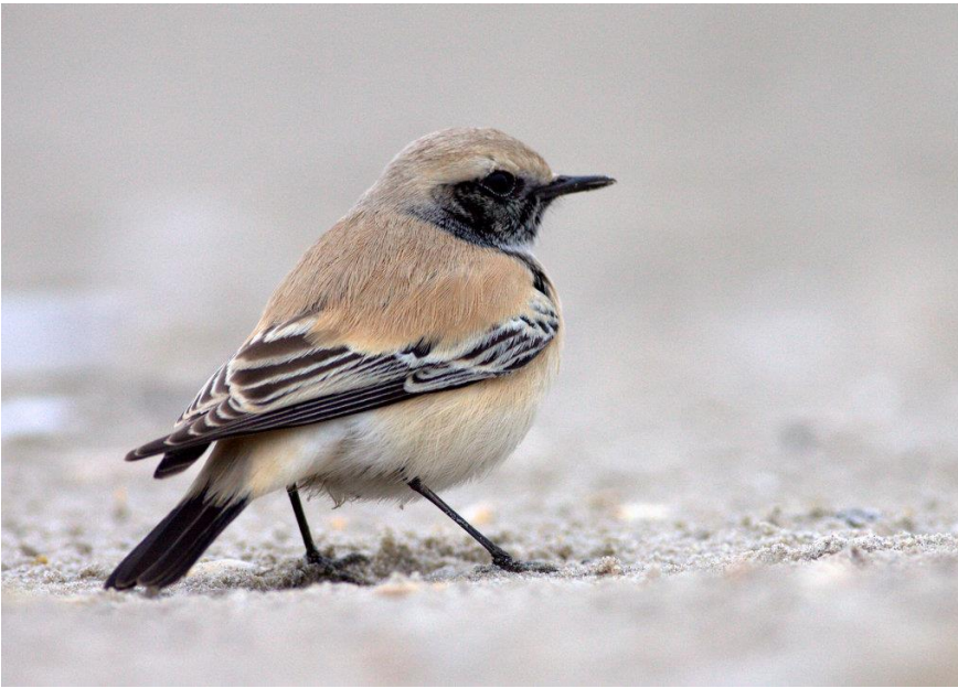
Ørkenstenpikker 16. oktober 2013 Blåvands Huk.

22. december 2015 1 1K/hun rast Blåvands Huk