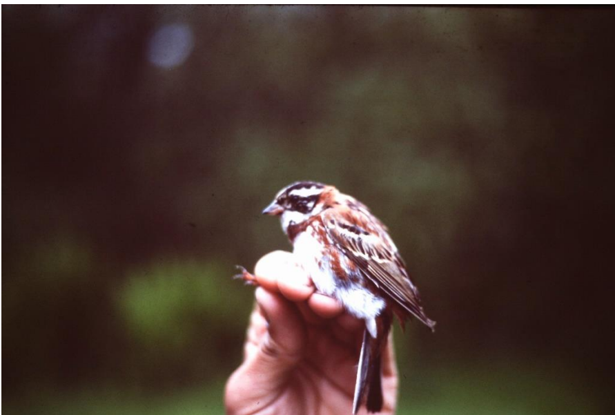
Pileværling 29. maj 1987.