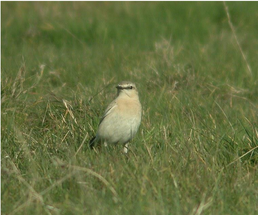
Isabellastenpikker 13. oktober 2005. Nyeng.