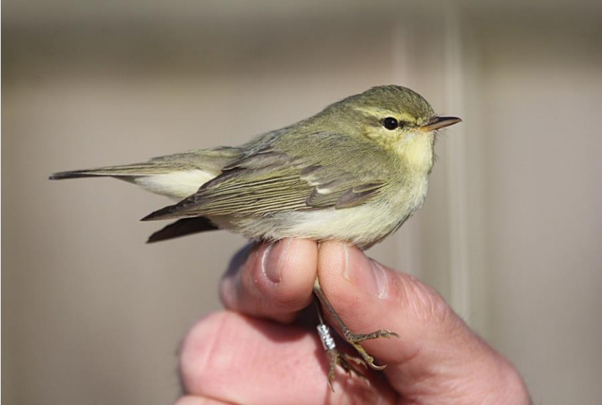
Kaukasisk Lundsanger 27. maj 2015.

27. maj 2015 1 ringmærket Blåvands Huk 1. fund for Danmark. Fuglen blev bl.a. bestemt ved hjælp af DNA.