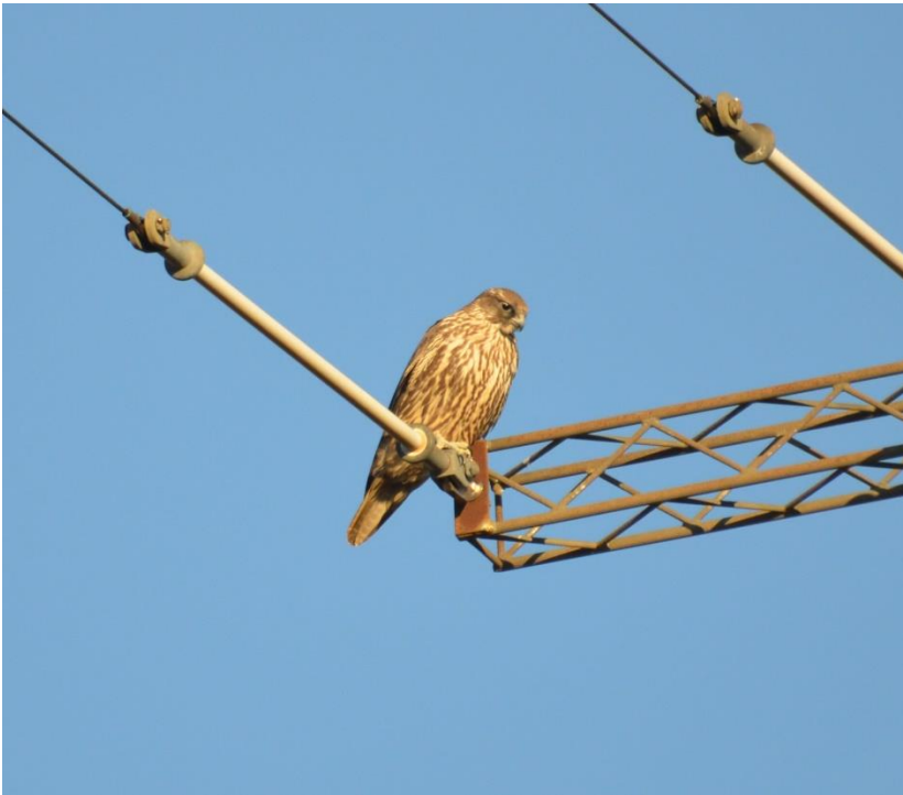
Jagtfalk 6.-12. december 2012.