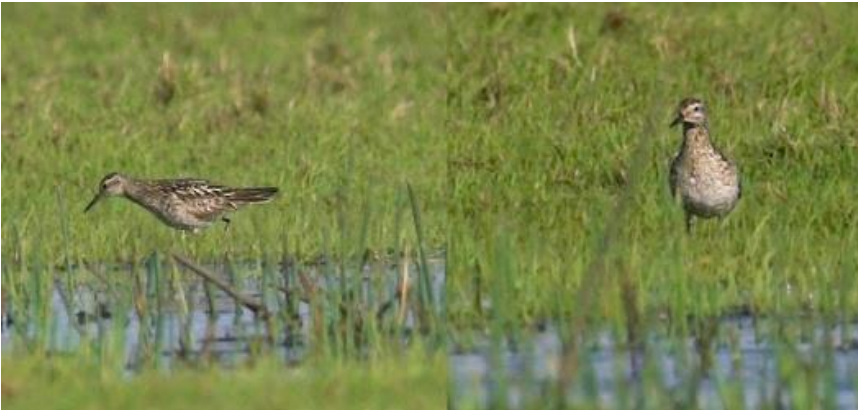
Spidshalet ryle 8.-9. september 2011.

8.-9. september 2011 1 rast Grønningen, Blåvand. 2. fund for Danmark