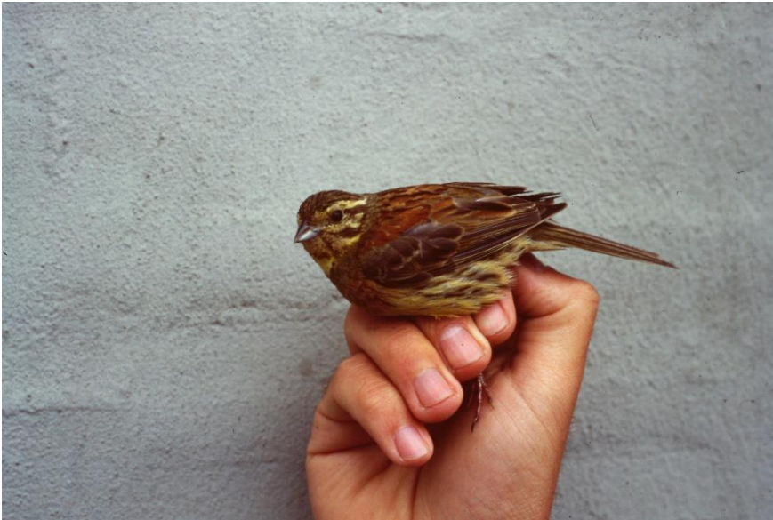
Gærdeværling 10. juni 1995.