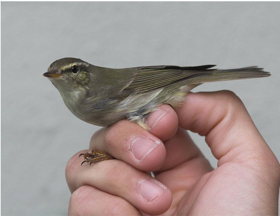
Nordsanger 11. august 2008.