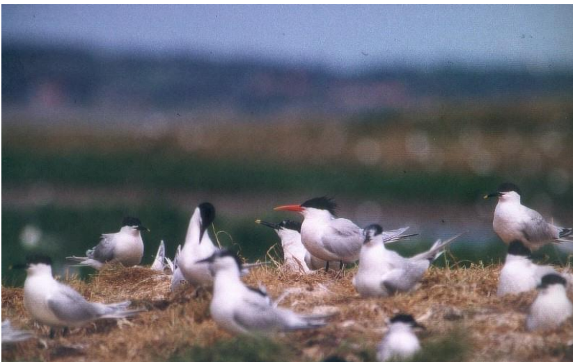
Aztekerterne 30. maj – 12. juni 2000. Langli.