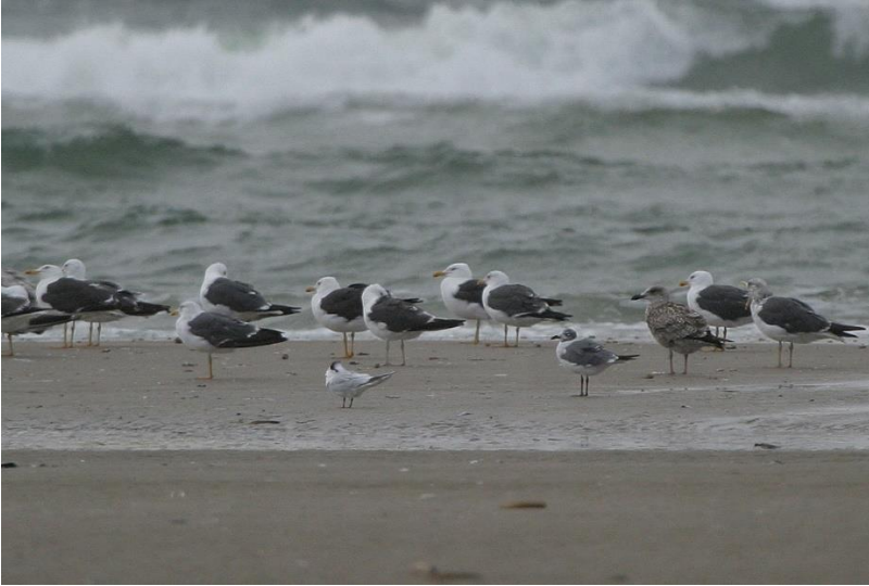
Lattermåge 26. august 2008.