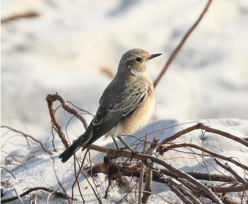
Nonnestenpikker 17. oktober 2018. Skallingen.