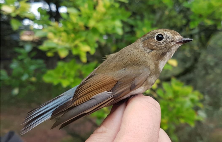
Blåstjert 13. oktober 2020. Blåvands Huk.