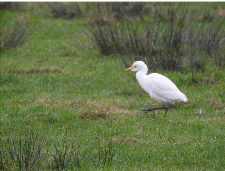
Kohejre 23. november 2018. Filsø.

23. november 2018 – 19. januar 2019 1 rast ved Filsø