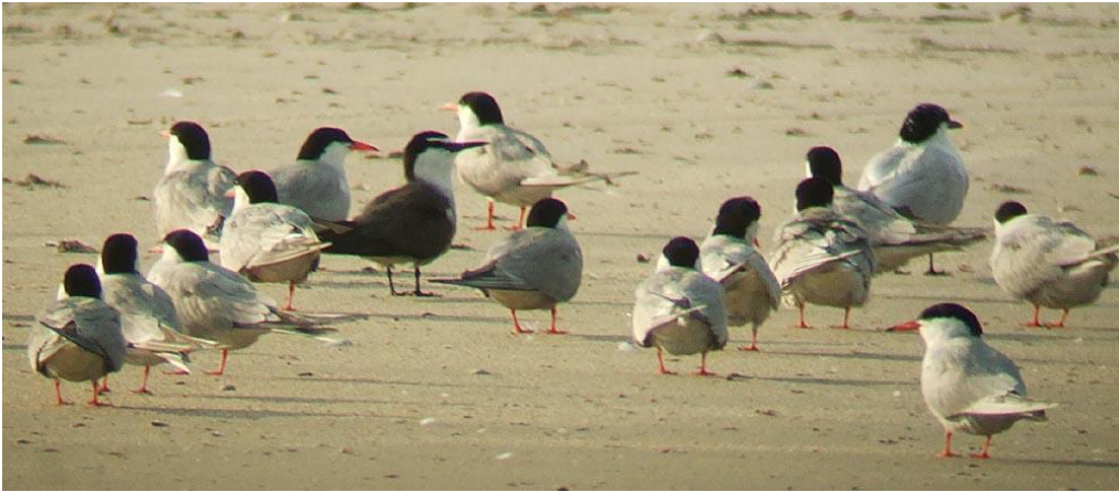
Brilleterne. 22. juli 2007.

21.-22. juli 2007 1 rast Blåvands Huk 3. fund for Danmark