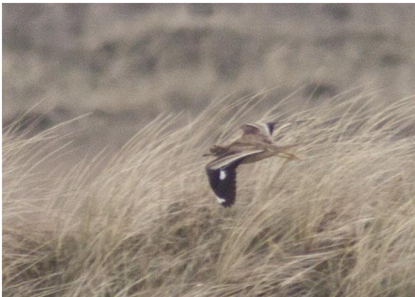
Triel. 24. april 2015.

Maj 1963 1 mellem Ho plantage og Lysbjerg plantage 7. maj 2010 1 Grærup Langsø 24. april 2015 1 indtrækkende Blåvands Huk. 13. maj 2018 1 trækkende Blåvands Huk