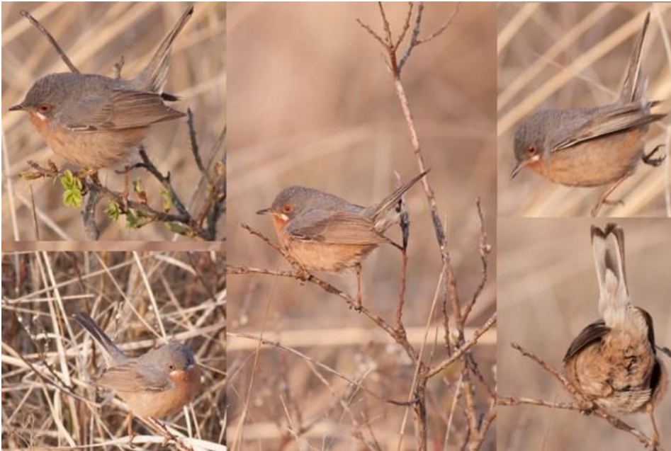
Iberisk sanger 20. april 2011. Blåvands Huk.