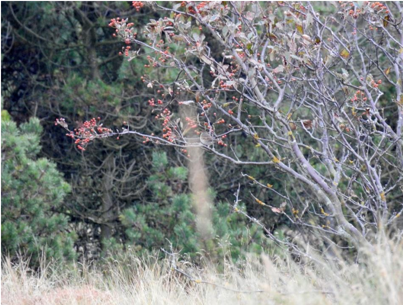
Sortstrubet drossel 13. oktober 2015. Grønningen.