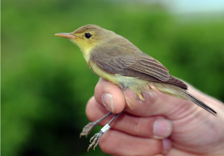
Spottesanger 6. juni 2010.