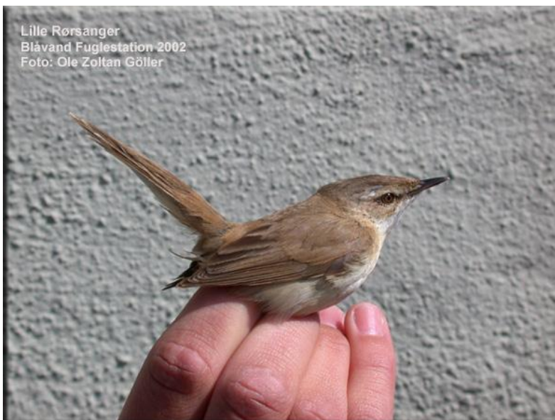
Lille rørsanger 27. maj 2002.

14.-15. oktober 2019 1 rast Blåvands Huk