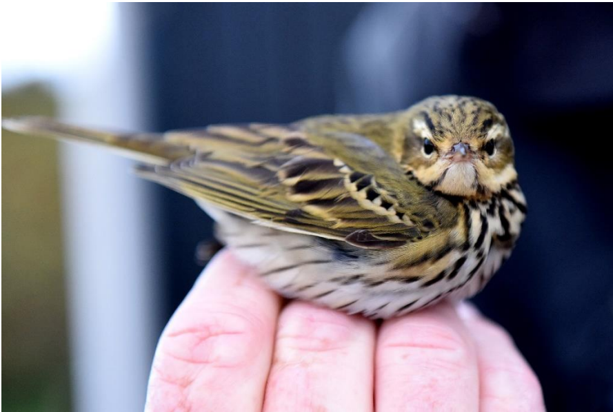
Tjagapiber 19. oktober 2018. Blåvands Huk.

13. oktober 2014 1 rast Sct. Enders Kapel, Hvidbjerg 13. oktober 2018 1 rast Ho klitplantage 19. oktober 2018 1 ringmærket Blåvands Huk 13. oktober 2019 1 rast Blåvand 15. oktober 2020 1 rast Skallingen