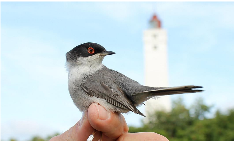
Sorthovedet sanger 15. juni 2011. Blåvands Huk.

Fuglen i 2011 holdt til i området omkring fuglestation og fyret. I august blev fuglen genfanget og var i kraftig fældning.