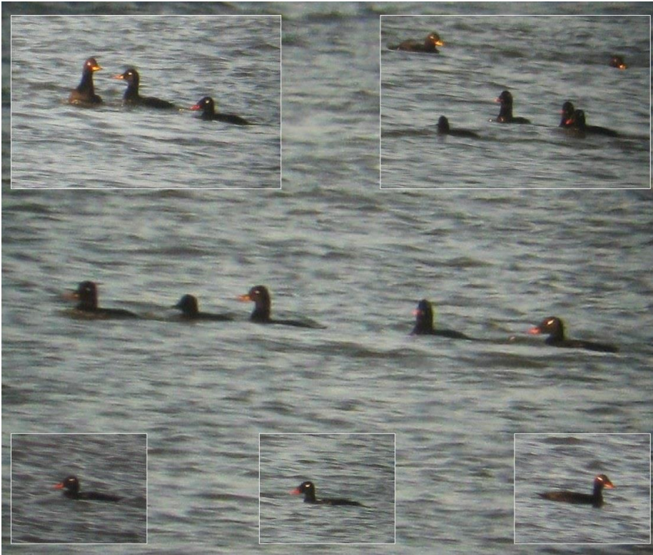
Sibirisk Fløjsand 13. oktober 2009.