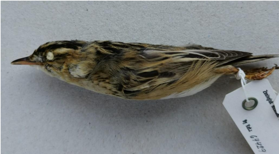
Vandsanger 13. august 1948. Zoologisk Museums skindsamling.