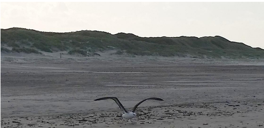
Sortbrynet albatros 7. juni 2015.

Ved fuglen d. 7. juni fik fuglestationen nogle fotos tilsendt af en fugl som iagttageren ikke var helt sikker på var en måge eller en albatros. Fuglen var ikke set på Helgoland d. 5. og 6. juni men vendte til øen d. 7. juni kl. 21.