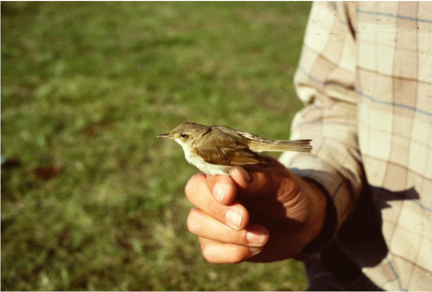
Lille Gulbug 8. september 1988. Langli.

27. september 1989 1 rast Blåvands Huk 3. fund for Danmark