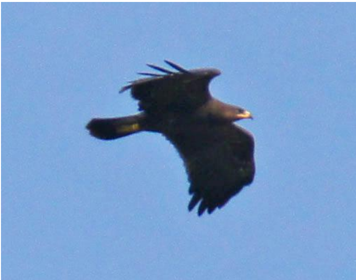
Lille skrigeørn 16. september 2014.

16. september 2014 1 trækkende Blåvands Huk.