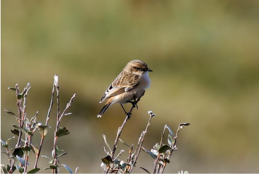
Sibirisk bynkefugl 17. oktober 2007.