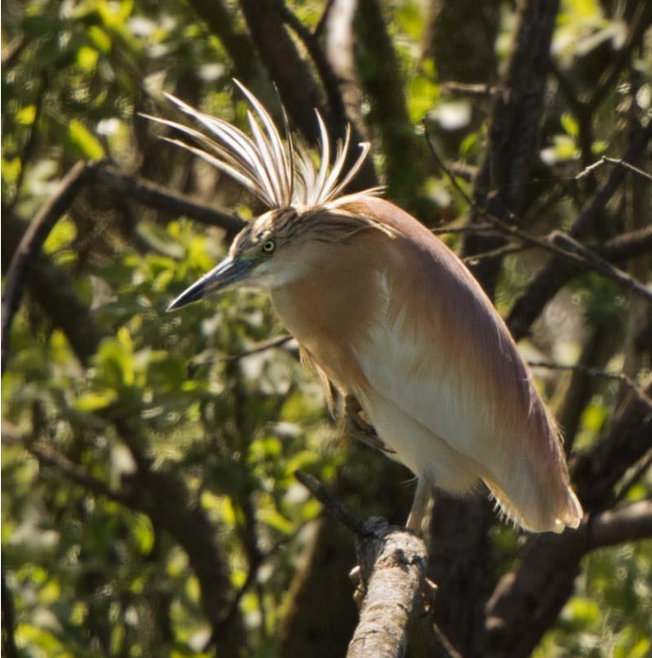
Tophejre 21. maj 2017. Filsø.