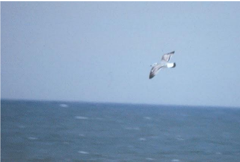
Stor sorthovedet måge. 10. oktober 1993.

10. oktober 1993 1 1K rast Blåvands Huk 1. fund for Danmark