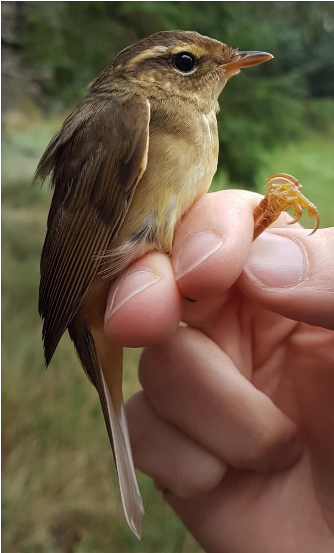
Schwarz Løvsanger 8. oktober 2020. Blåvands Huk.