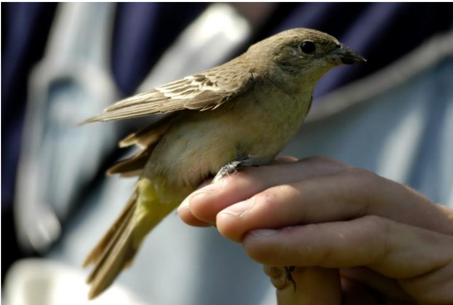
Hætteværling 28. maj 2005.

15. oktober 2019 1 Blåvands Huk 31. fund for Danmark.