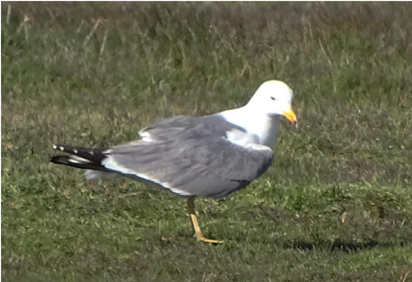
Armensk Måge 4. maj 2017 Grønningen.