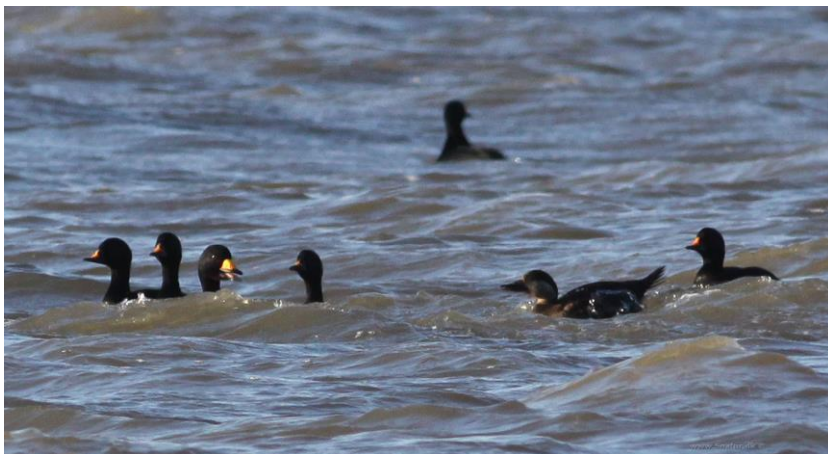
Amerikansk Sortand 19. februar 2011.

17. oktober – 21. november 2014 1 han ad rast Blåvands Huk (samme fugl) 17. januar – 22. marts 2015 1 han ad rast Blåvands Huk (samme fugl) 10. oktober – 13. november 2015 1 han ad rast Blåvands Huk (samme fugl) 14.-26, januar 2016 1 han ad rast Hvidbjerg Strand (samme fugl) 30. september – 23. oktober 2016 1 han ad rast Blåvands Huk (samme fugl) 21. januar 2017 1 han ad rast Blåvands Huk (samme fugl) 27. januar 2017 1 han ad rast Blåvands Huk (samme fugl) 2. oktober 2017 1 han ad rast Blåvands Huk (samme fugl) 6. januar 2018 1 han ad rast Hvidbjerg strand (samme fugl) 26. september 2018 1 han ad trækkende Blåvands Huk (samme fugl) 17.-19. oktober 2018 1 han ad rast Hvidbjerg strand (samme fugl) 5. januar – 2. marts 2019 1 han ad rast Hvidbjerg strand (samme fugl) 12.-21. oktober 2019 1 han rast Hvidbjerg strand (samme fugl) 2. marts 2020 2 han ad rast Blåvand/Hvidbjerg strand 7. marts 2020 1 han ad rast Skallingen 11.-15. oktober 2020 2 han ad rast Blåvand/Hvidbjerg strand 17. december 2020 1 han ad rast Esperance bugt maritim. Observationerne følger den reviderede liste fra sjældenhedsudvalget, hvor det er beregnet, at der har været 5 forskellige fugle til og med 2019. Når observationerne fra 2020 er behandlet opdateres listen.