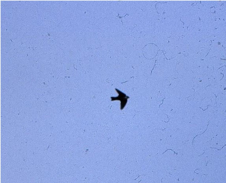
Klippesvale. 4. maj 2000.

4. maj 2000 1 trækkende Blåvands Huk 3. fund for Danmark