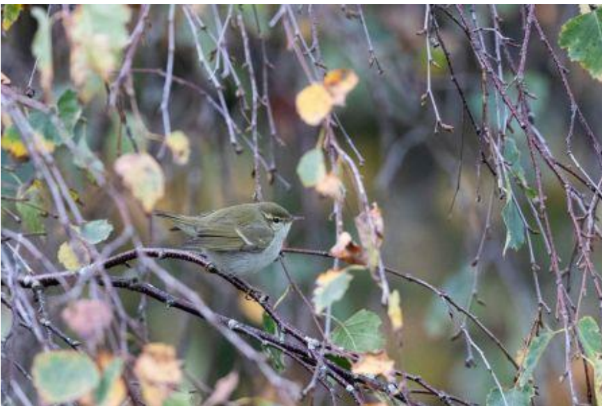
Østlig lundsanger 18.-20. oktober 2019, Tipmose.

18.-20. oktober 2019 1 rastTipmose 1. fund for Danmark