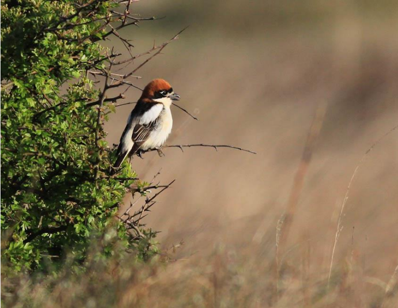
Rødhovedet tornskade 9. maj 2009.

8.-9. maj 2009 1 han 2K rast Blåvands Huk 21.-23. maj 2009 1 han rast Blåvands Huk 24. maj 2009 1 han ad rast Blåvands Huk (ny fugl)