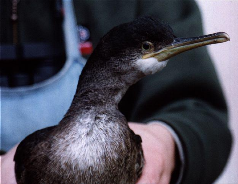
Topskarv ringmærket 13. november 2000.