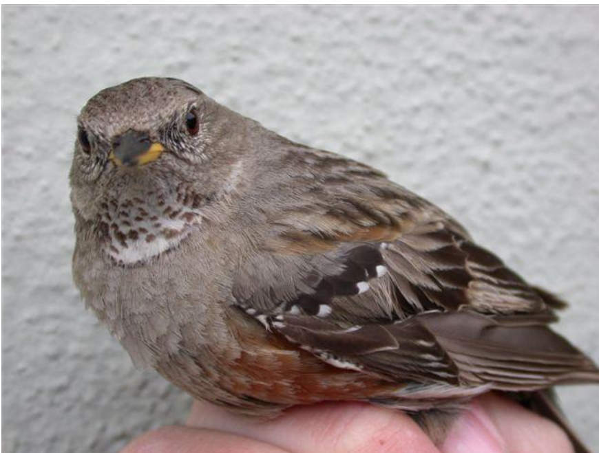
Alpejernspurv 11. maj 2004.

11.-12. maj 2004 1 2K ringmærket Blåvands Huk 10. fund for Danmark