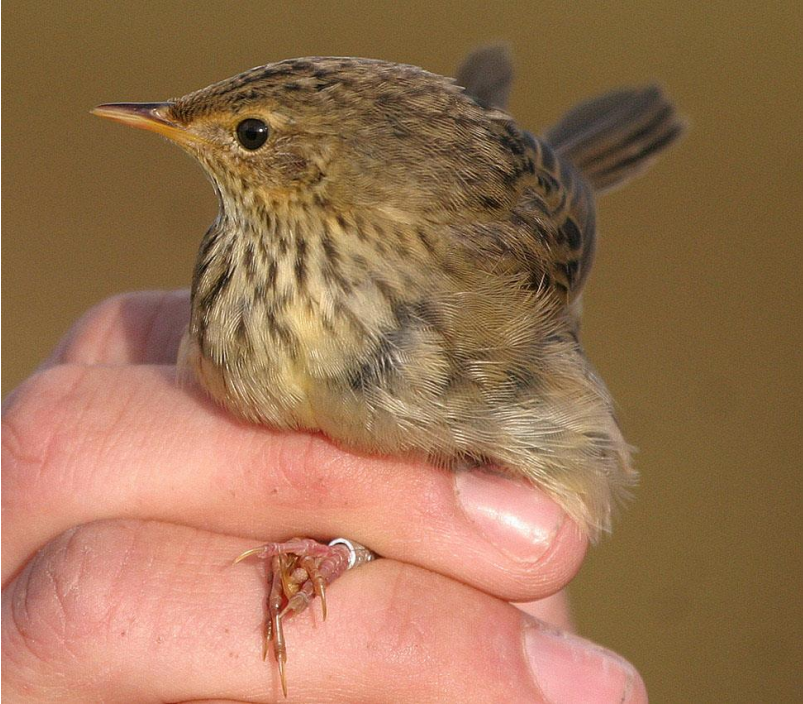
Stribet Græshoppesanger 17. oktober 2008. Grønningen.