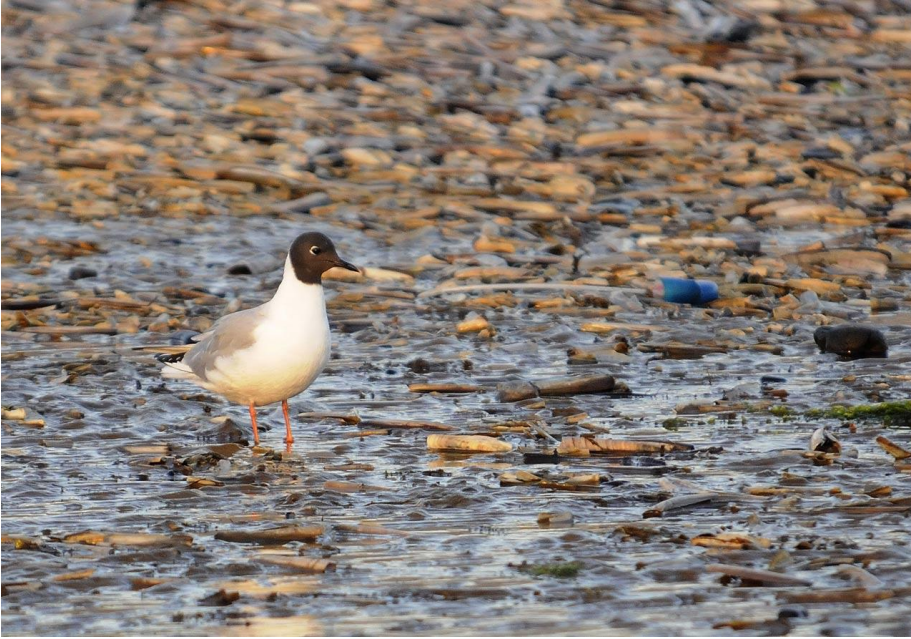
Bonapartemåge 4. august 2012.