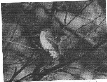
Fig. 1. Brun Fluesnapper ( Muscicapa latirostris ) ved Blåvand. Brown Flycatcher ( Muscicapa latirostris ) at Blåvand.

Ved nærmere undersøgelse af litteratur viste det sig, at der kun eksisterer meget få feltbeskrivelser af arten; beskrivelser af skind (WILLIAMS et al. 1945 og HARTWIG 1910) stemmer dog med vore optagelser. Yderligere kunne jeg undersøge skind af Brun Fluesnapper i Zool. Museums samling, og disse passede også med vore iagttagelser.