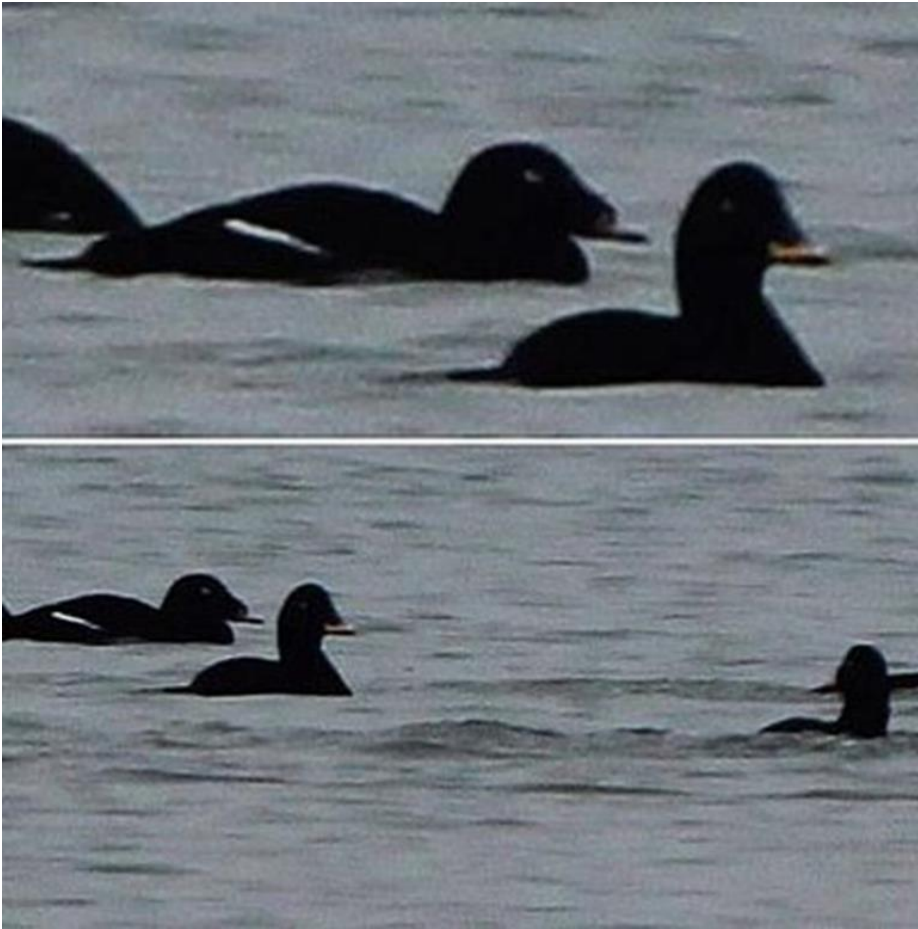
Amerikansk Fløjlsand 26. februar 2013. Blåvands Huk.