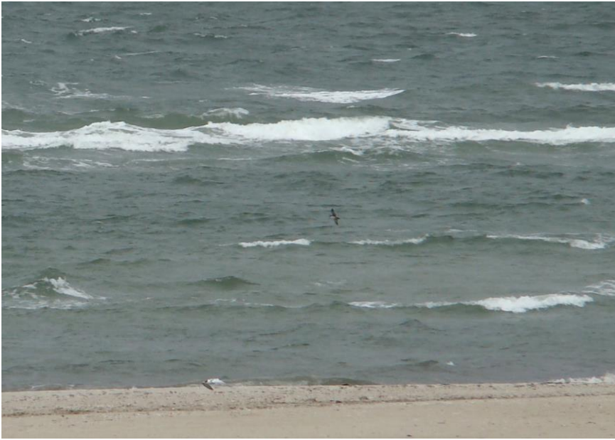
Balearskråpe. 20.-25. juli 2009. Blåvands Huk.