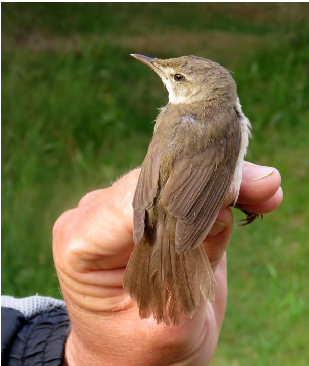
Buskrørsanger 10 juni 2019. Blåvands Huk.