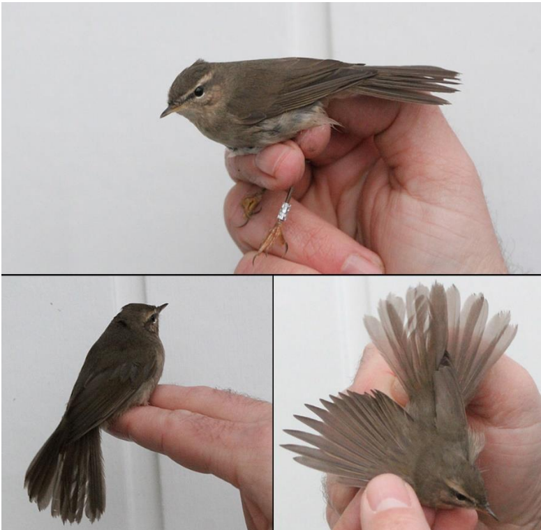
Brun løvsanger 13. november 2012.

13.-15. oktober 2013 1 rast Blåvand 29. oktober 2014 1 rast Blåvands Huk 19. oktober 2016 1 rast Blåvands Huk 23. november 2016 1 ringmærket Blåvands huk 19.-20. oktober 2017 1 rast Hvidbjerg strand 20. oktober 2017 1 rast Blåvands Huk 11. oktober 2020 1 rast Kallesmærsk Hede 11. oktober 2020 1 rast Tipmosen 17.-18. oktober 2020 1 rast Tipmosen