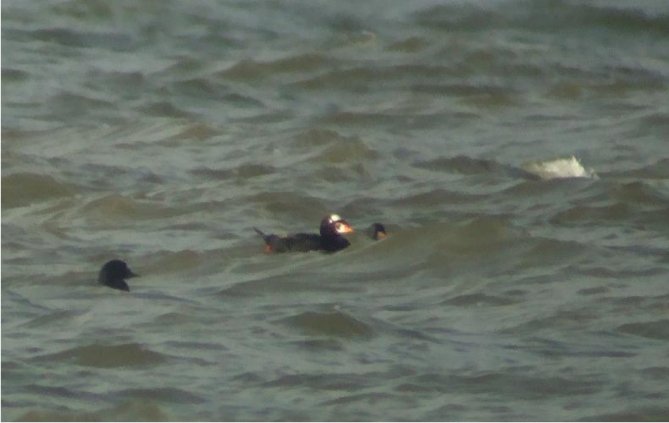
Brilleand 17. oktober 2010.