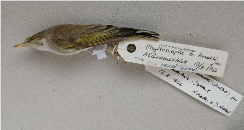
Bjergløvsanger 13. august 1966. Fra Zoologisk Museums skindsamling.