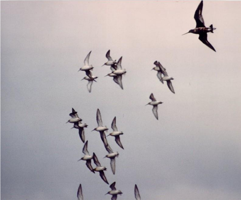
Canadisk kobbersnepe 6. september 1986. Kjelst enge.